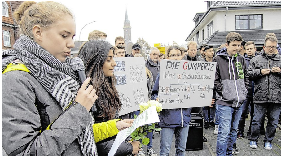
Engagiert in Rhauderfehn: Zwei Jahre lang hat sich der Geschichtskursus des Gymnasiums in Rhauderfehn um das Erinnern – wie hier bei einer Gedenkveranstaltung an der Rhauderwieke – bemüht.

In der Zeit haben sie unter anderem über die Schicksale ostfriesischer Juden recherchiert, zu der Informationsveranstaltung „Der Würde Raum geben“ eingeladen und eine Unterschriftenaktion gestartet, um am Standort der ehemaligen Synagoge in Leer eine Gedenkstätte auf-