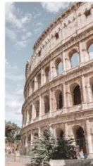
Kolosseum in Rom