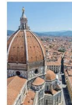
Kathedrale in Florenz